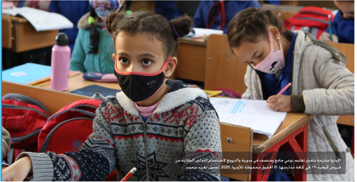
الأونروا ملتزمة بتقديم تعليم نوعي جامع ومنصف في سورية والترويج لاستخدام التدابير الوقائية من فيروس كوفيد-19 في كافة مدارسها.